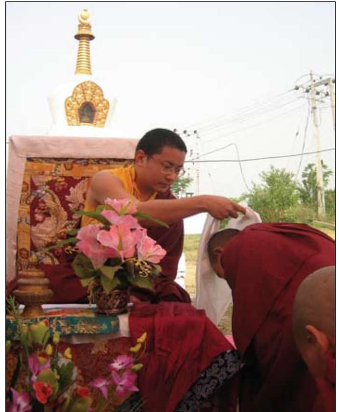
S.E. Khamtrul Rinpoche bendice a una monja DGL en la Puja del Templo

Las monjas están muy entusiasmadas ya que las obras del Centro de Estudios y del Centro de Retiros están llegando a su fin. Un largo monzón retrasó el progreso. Para el tiempo que lean esto estaremos amueblando las clases del Centro de Estudios y las monjas dejarán de tomarlas en los dormitorios. El Centro de Retiros será el primero en finalizarse. Ya que muchas de las monjas de mayor antigüedad pronto entrarán en retiro. Llevará tiempo (¡y dinero!) decorar el gran Salón para Puja del Centro de Estudios y los dos santuarios más pequeños en las dos alas del Centro de Retiros. Las esculturas, thangkas, altares y tronos se irán haciendo a medida que los fondos lo permitan. Lo mismo ocurrirá con las bibliotecas de madera de la Biblioteca.