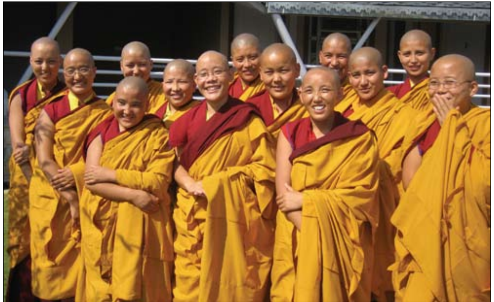
Un grupo de novicias felices

Para permitir que el mayor número posible de monjas pueda expresarse publicamos una relación cruzada de sus escritos para relatar los eventos.