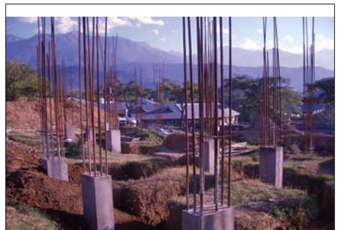
Los cimientos del Templo

El 10 de junio S.E. Khamtrul Rinpoche y otros monjes de Tashi Jong vinieron para dirigir la puja para el nuevo Templo. Esta puja particular remueve obstáculos del Templo ahora en construcción. El Templo va ser el corazón del convento. Los cimientos del Templo están terminados y se están haciendo sus columnas. Ahora que ha concluido la estación de lluvias el trabajo se acelerará. La casa de la entrada está lista y la pequeña clínica enfrente de la entrada a la oficina lo estará pronto. Todavía falta mucho por hacer pero el lugar empieza a parecerse un convento donde se vive y se trabaja.