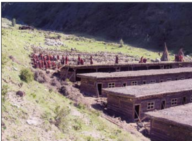
Alojamientos sencillos, en un convento en Tibet

Se le ha pedido a Venerable Tenzin Palmo ayudar a 75 monjas en el Tíbet que están en necesidad extrema. Estas monjas estuvieron ocupadas, por muchos años, en una intensa práctica espiritual con su maestro en las montañas. Al morir él, regresaron al monasterio para encontrarlo ocupado por los aldeanos, quedando ellas indigentes. DGL ha apoyado a sus hermanas en el Dharma, en el último invierno con dinero para refugio temporario, alimentos y vestimenta. Recientemente las monjas recibieron unos terrenos cercanos a un monasterio y con dinero sobrante de la donación original del convento DGL han comenzado a construir unos sencillos alojamientos de madera y tierra.