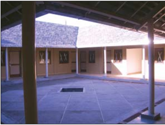
El Centro de Retiro