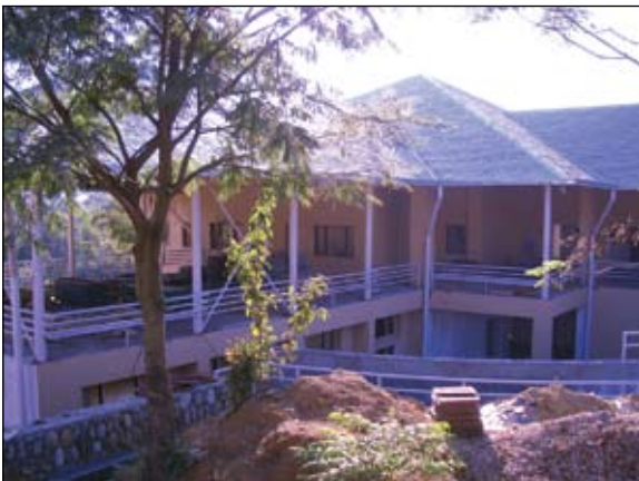
El Centro de Estudios