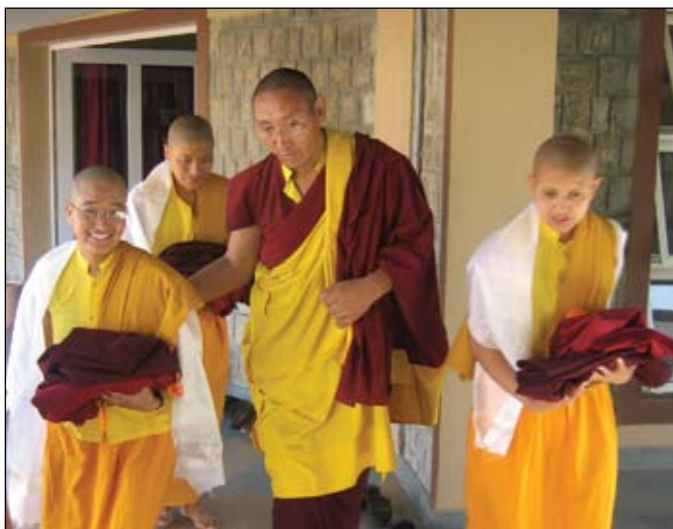
Gen Lodro supervisando a las monjas durante la ceremonia

El 19 de abril de 2007 S.E. Dorzong Rinpoche, Popa Rinpoche, Khenpo Losal y 7 monjes de Tashi Jong vinieron al convento. Vinieron porque algunas de nuestras monjas tenían que recibir la ordenación Getsul. Cuando Rinpoche llegó hicimos humo porque eso es parte de la cultura tibetana. .