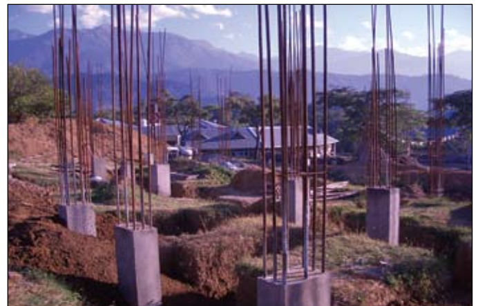
Les Fondations du Temple

La maison du gardien est prête et la petite clinique située en face de l'entrée administrative sera bientôt terminée. Il reste encore beaucoup de travail à faire, mais le site commence vraiment à ressembler à un monastère vivant et actif.