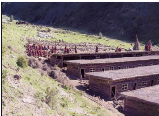
Des Habitations Rudimentaires, un Monastère au Tibet