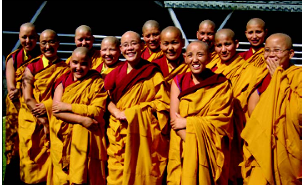
קבוצה שמחה של נזירות חדשות

כדי לתת לכמה שיותר נזירות לבטא את המחשבות שלהן, אנו מפרסמים קטעים ממה שהן כתבו על ארועים אלו.