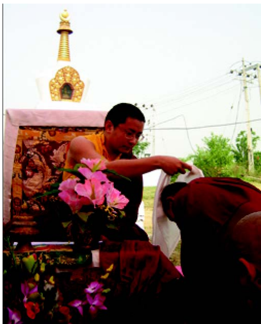
הוד קדושתו קמטרול רינפוצ'ה מברך נזירה מהמנזר בפוג'ת המקדש

הוד קדושתו קמטרול רינפוצ'ה ומספר נזירים מטאשי גיונג הגיעו בעשרה ביוני כדי להעביר את הפוג'ה למקדש החדש. הפוג'ה הייחודית הזו נועדה להסרת מכשולים מתהליכי הקמת המקדש, אשר יהווה את לבו של המנזר.